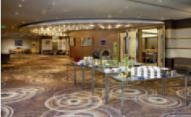
Most MICE events are staged in the hotels.

programme also provides personal service before, during and after each event. The Personalised Online Group (POG) is an exclusive website that will deliver information on rooms, the hotel and